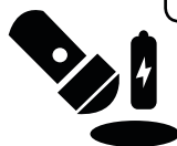
Latarka i baterie